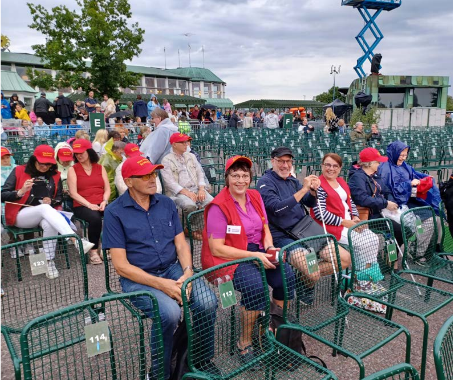
■ Stockholm. I väntan på Allsång på Skansen. Kvällen slutade i ösregn och jubel.

säkerheten själv rattade han den stora turistbussen på alla möjliga och omöjliga gator t.o.m. mitt i Stockholms innerstad.