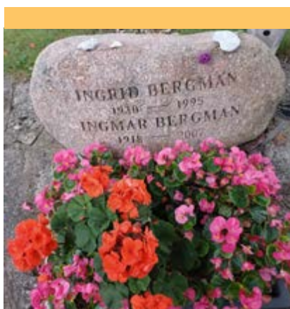
■ Gotland. Ingmar Bergmans grav på Fårö.

älv, har ingen kraft att flyta själv. Det ställs ett krav på varenda droppe: Hjälp till att hålla de andra uppe!”