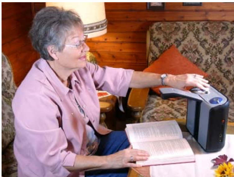
ClearReader läsmaskinen skannar texten och läser den högt.